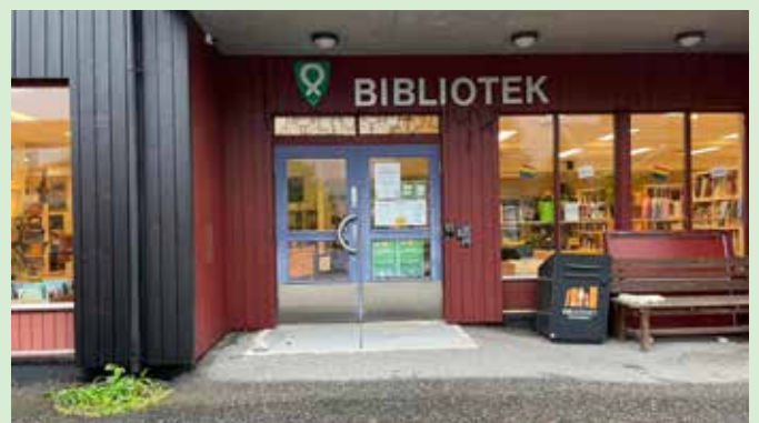
Øyer bibliotek har tatt i bruk Fri meråpent.

I tillegg har følgende bibliotek tatt i bruk Fri meråpent: Farsund, Øyer, Time og Sør-Aurdal. Vi takker for tilliten!