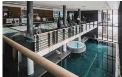
Hold av 25. og 26. september 2025 for Bibliofils lederkonferanse på Farris bad.

Programmet er ikke klart, men vi ber dere allerede nå om å holde av dagene torsdag 25. september og fredag 26. september i 2025 for å ta turen til Farris Bad i Larvik. Vi har allerede begynt å glede oss!