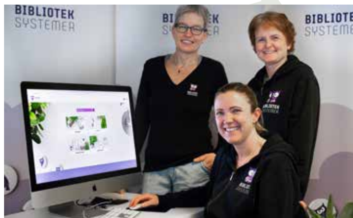
Velkommen til digitale kurs med bibliotekarene i Bibliotek-Systemer!

Med periodikamodulen holder man oversikt over tidsskriftabonnementene man har, og man kan enkelt motta nye hefter – samt legge inn hefter retrospektivt, registrere ekstra hefter mm. Vi går gjennom prosessen fra å registrere et nytt periodikum, til heftemottak, samt jobber og rapporter knyttet til periodika.