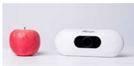
Milesight VS133-P er en personteller som er integrert med Bibliofil.

For bibliotek er Milesight VS133-P et effektivt verktøy for å få bedre oversikt over besøkende, optimalisere driften og forbedre tjenestene. Integrasjonen med Bibliofil gjør at data kan analyseres sømløst, og gir ledelsen et bedre grunnlag for beslutninger som bidrar til å forbedre både brukeropplevelsen og den interne ressursstyringen.