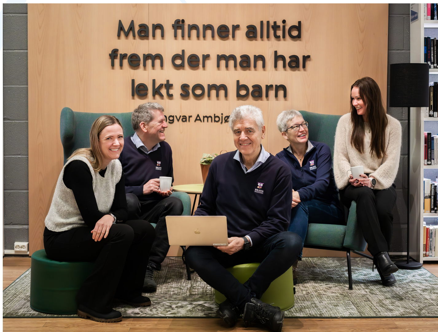
Du kan møte flere fra Bibliotek-Systemer på Bibliotekmøte i Haugesund i april.

Vi gleder oss til å møte dere i Haugesund!