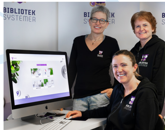
Velkommen til digitale kurs våren 2024!

Ved bruk av innkjøpsmodulen får man full oversikt over leverandører, bestillinger og budsjett. På dette kurset går vi gjennom hele modulen.