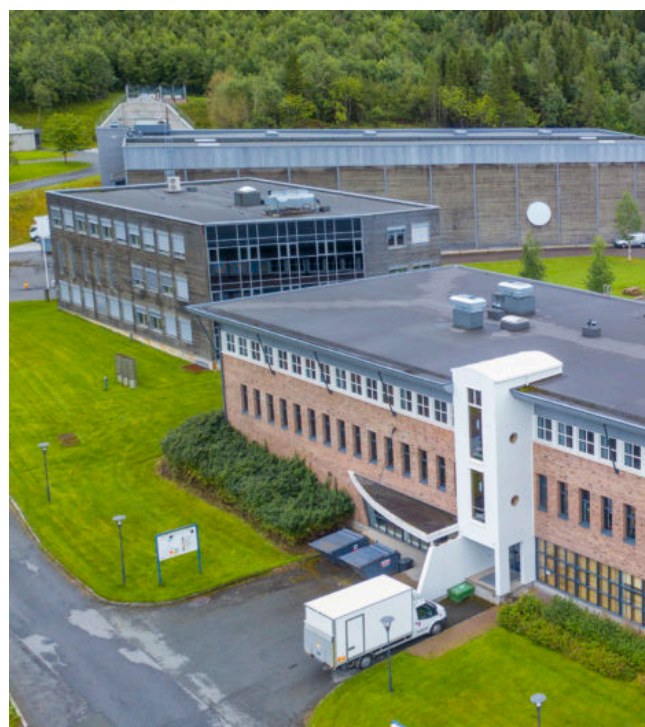
Velkommen til Mo i Rana og Nasjonalbiblioteket.

I og med at vi skal samles på et sted med så tett kompetanse på feltet, har vi i arbeidsutvalget gleden av å invitere til en NB-spesial av et Brukermøte. Det betyr at programmet består av fagfolk og prosjekter fra Nasjonalbiblioteket. Vi legger opp til et program spekket av interessante foredrag, presentasjoner og, ikke minst, omvisning på Nasjonalbiblioteket. Alt altså med utgangspunkt i Nasjonalbibliotekets avdelinger på Mo. I tillegg til NB-programmet