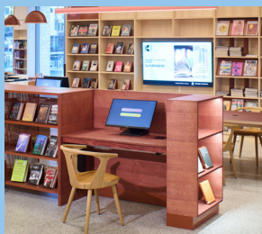
Suksess med nytt bibliotek i Steinkjer LES MER PÅ SIDE 4 og 5

Nasjonalbiblioteket er vertskap for årets Brukermøte.