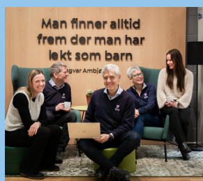
Møt oss i Haugesund LES MER PÅ SIDE 6