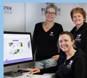
Velkommen på kurs LES MER PÅ SIDE 7