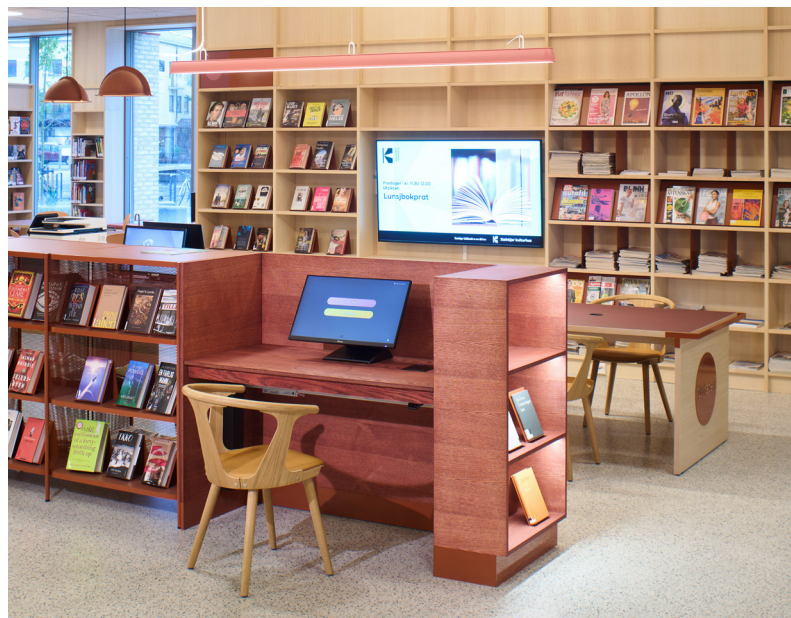
Biblioteket har flere automater fra Bibliotek-Systemer.

Steinkjer bibliotek er samlokalisert med en rekke andre kulturaktører i Steinkjer kulturhus. Her finnes Stiftinga Hilmar Alexandersen (folkedans og musikk), Steinkaret (multidigitalt visningsrom), Kunstrom Jakob (gallerirom), HEIM (museumsrom for utstilling av arkeologiske gjenstander), kino, kafe og en rekke saler. Dette åpner opp for spennende muligheter for samhandling rundt arrangementer og aktiviteter. De fleste større arrangementer i regi av biblioteket holdes i disse salene, mens mindre arrangementer foregår i Krimloungen eller på Utsikten.