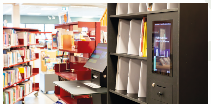
Frikk og Ida, to nye produkter fra Bibliotek-Systemer As i Stokke bibliotek.

PS. Rett før Infobrevet gikk i trykken fikk Stokke bibliotek klarsignal om å beholde Frikk.