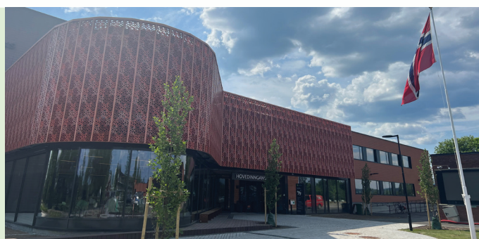
Nannestad bibliotek har flyttet inn i nye lokaler i kommunehuset og tatt i bruk FRI Meråpent bibliotek.

Vi takker også for tilliten fra skolene i Narvik som valgte Bibliofil som biblioteksystem i deres anbudskonkurranse.