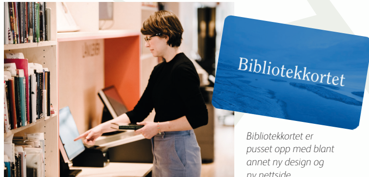
Bibliotekkortet kan brukes i alle folkebibliotek.

Blant det som allerede er på plass er ulike sikkerhetsnivå for autentisering, mulighet for pålogging med Feide, mulighet for å melde seg ut av registeret, at en bruker får beskjed når hen blir bruker ved et nytt bibliotek, og at en kan slette sin bruker i det nasjonale lånerregisteret.