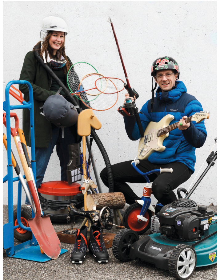
Fra 1. november kan du booke utstyr i den nye modulen Tinging i Bibliofil.

Ta kontakt på: firmapost@bibsyst.no for mer informasjon.