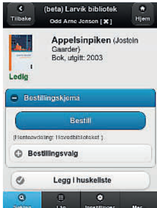
Postvisning med bestillingskjema