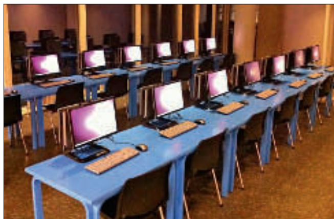
Publikumsmaskiner basert på halvtykke klienter. Bilde fra Trondheim folkebibliotek.

Bilde til venstre: Halvtykk klient, satt opp med websøk-oppsett til søk i egen base, uten innlogging, ved Larvik bibliotek.