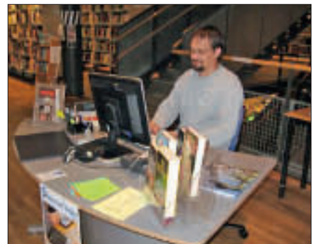
Fra bibliotekovertakelsen i Tønsberg og Nøtterøy bibliotek i 2010.