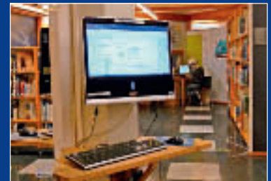
Publikumsmaskiner med pålogging og karantenetid, s. 6