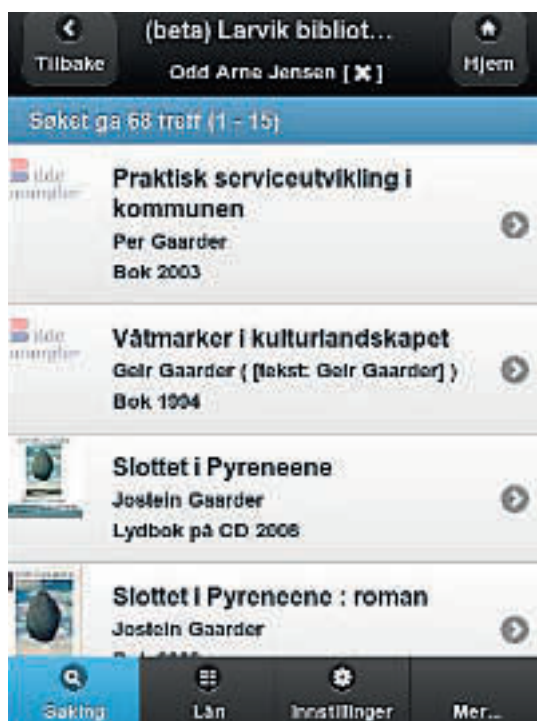
Trefflisten viser kun de viktigste opplysningene

denne nettsiden. Etter å ha gjort et søk kommer du til trefflisten , som kun viser de viktigste opplysningene: