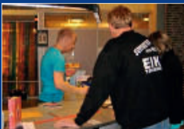
Bibliotek-Systemer overtar et bibliotek for én dag, s. 3