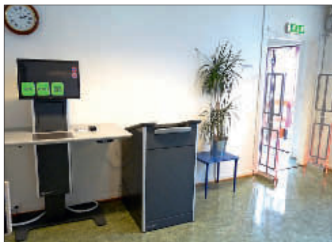
Portaler settes opp ved utgangen for tyverisikring. Innebygd personteller sørger for statistikk. Utlån skjer på selvbetjeningsautomat.

Det kan også settes opp generelle overvåkningskameraer . Opptak fra disse kan sjekkes dersom noe galt har skjedd. Kameraene aktiveres ved bevegelse. Via en pc på det administrative nettverket kan man se video fra kameraene live, eller inntil 7 dager gamle opptak. Der setter Datatilsynet en grense for lagring av video. Personfølsomme data og overvåkingsopptak skal behandles med forsiktighet, og bruken av dette skal kun skje der det har relevans i forhold til bibliotekets drift.